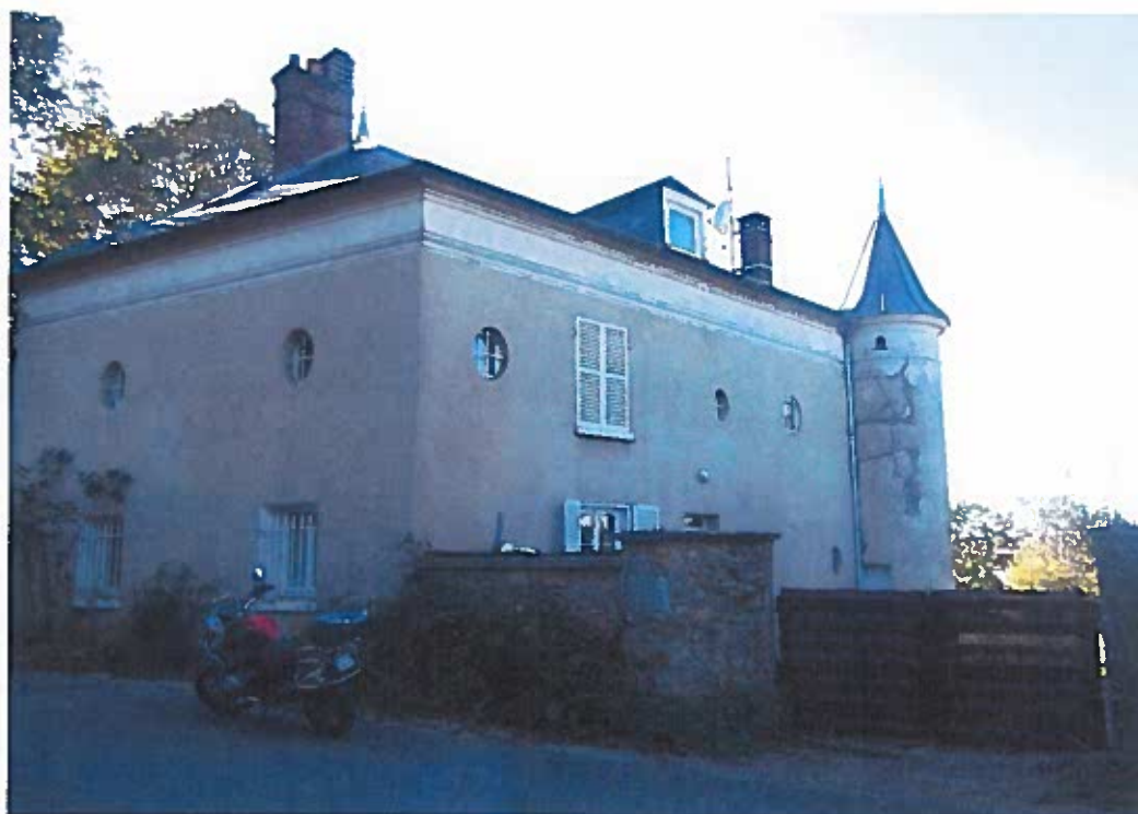
Façade sur rue

La maison en maçonnerie de briques ravalée et couverture d'une toiture en ardoise et s'élève sur une cave, un rez de jardin et deux étages.